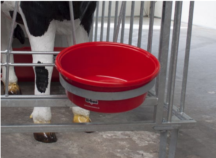
1 Futterschale 5 Liter passend für die Eimerringe an den Auslaufgittern