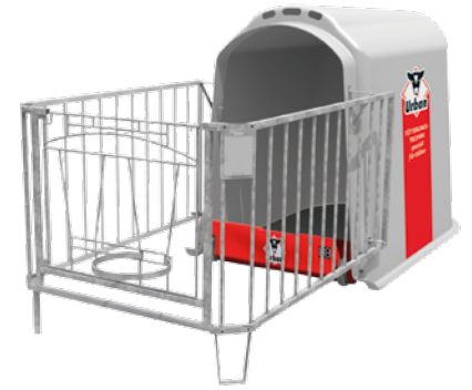
Abmessungen (L x B x H): Iglu: 200 x 120 x 140 cm Auslaufgitter: 150 x 120 x 95 cm