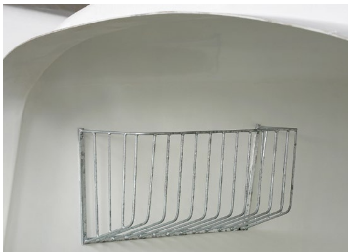
1 Heuraufe für die Kälberiglus XL und XXL