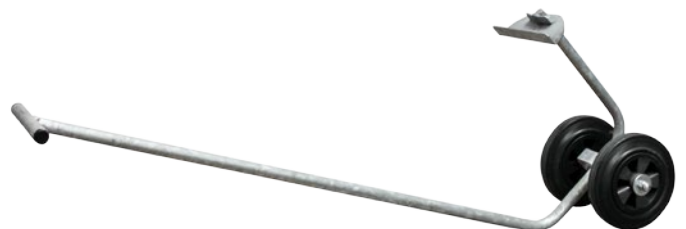
9 Transporthilfe für S & L Iglus