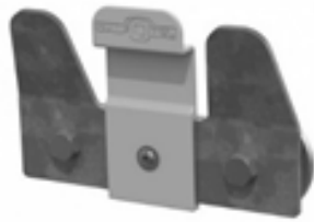
4 MULTILOCK Nuckeleimer und Combifeederhalter