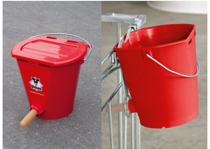
2 Nuckeleimer mit oder ohne Deckel