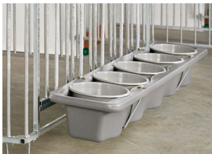
Der Kunststofffuttertrog kann mit fünf Futterschalen (Abb. 1, 5 oder 8 Liter ) bestückt werden