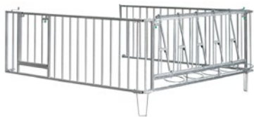
Auslauf mit Selbstfangfressgitter