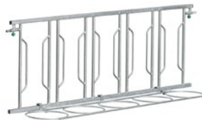
Frontgitter ohne Fangsystem

Die Umstellung von Einzelhaltung in Gruppenhaltung kann bei Kälbern zu Stress führen: