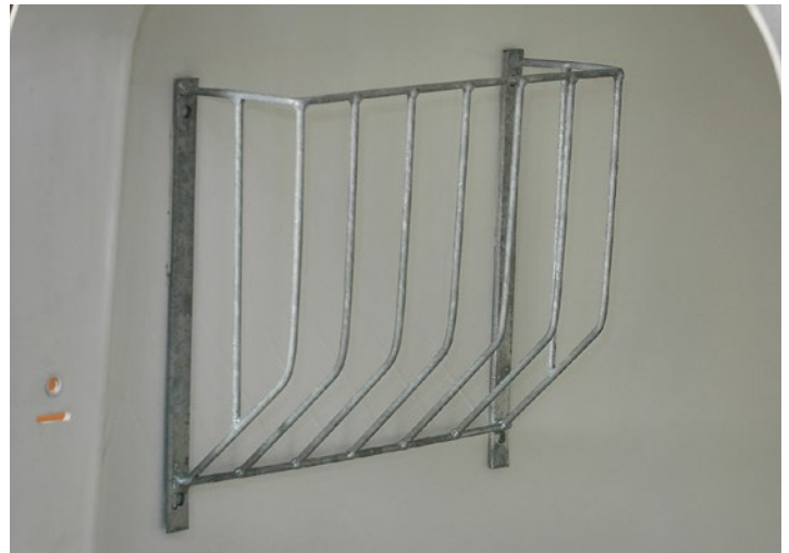
6 Heuraufe für die Kälberglus S und L