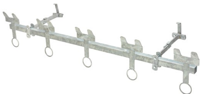
3 Klappbarer Nuckeleimerhalter