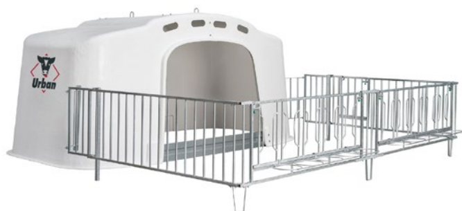
Auslaufgitter ohne Fangsystem