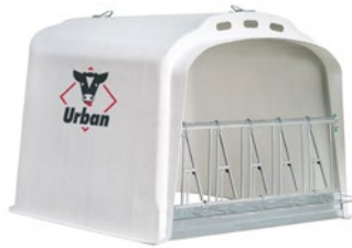
Frontgitter mit Selbstfangfressgitter