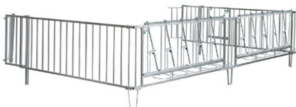
Auslauf mit Selbstfangfressgitter

Perfekt für größere Kälbergruppen, gegebenenfalls anwendbar mit einem Kälbertränkeautomat.