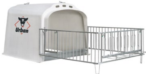
Auslaufgitter ohne Fangsystem