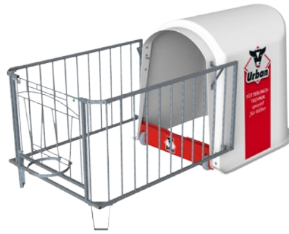
Abmessungen (L x B x H): Iglu: 150 x 120 x 125 cm Auslaufgitter: 150 x 120 x 95 cm