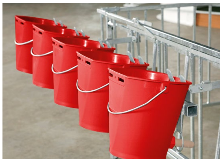
Der klappbare Nuckeleimerhalter trägt fünf Nuckeleimer